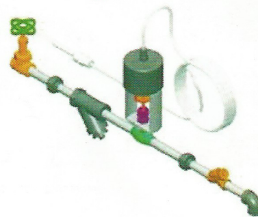
Equipo para pre calentamiento de Agua de Alimentación del Generador de Vapor